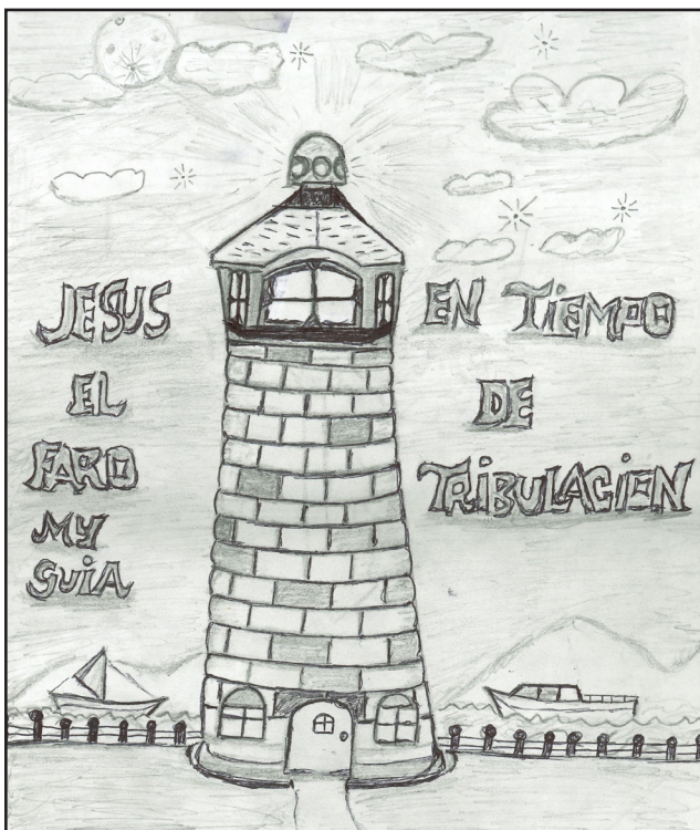
Jesus el faro mi guía en tiempo de tribulación, por Jose M.

¿SABÍA QUE CROSSROADS INCLUYE OBRAS DE ARTE DE LOS ESTUDIANTES EN SUS TARJETAS DE NAVIDAD? Comparta con nosotros su obra navideña antes del 1 de septiembre para tener la oportunidad de que su trabajo sea destacado.